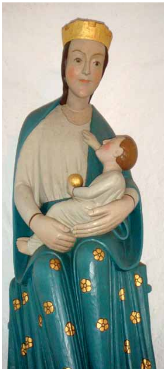
Maria med barn i Højrup Kirke

Kom ind i varmen! Verdens største fest hilser dig velkommen. Husk, den ægte vare fås kun i Guds hus. Derfor! Det starter lørdag. Derefter holder kirken søndagsåben. Og så mandagsåben! Gudstjeneste! Gudstjeneste! Gudstjeneste! Med verdens herligste helligdagstilbud! Juleaften, 1. juledag, 2. juledag! Vær med! Ordet "jul" minder om det hjul, der drejer rundt. Tag et stykke tråd og lav et hjul. Se på trådens ende! Det er pludselig begyndelsen! Som Jesus siger: Den sidste skal blive den første, og den første skal blive den sidste!