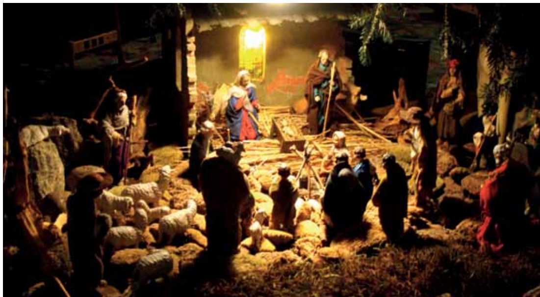
Foto: Krybbespil i Gedächtnis Kirche, Berlin

NR. 14 • DEC. 2011 - JAN. - FEB. 2012 • 4. ÅRGANG